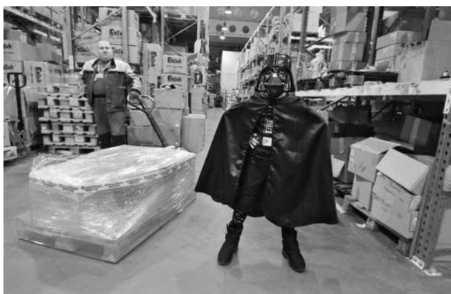
С главным злодеем из Звёздных войн (даже без меча) лучше не шутить!