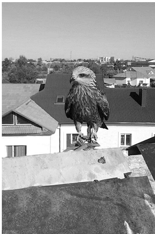
Сокол на крыше дома

Они предполагают, что птица могла содержаться в каком-то приезде цирке, выступавшем в этом году в городе, и сбежала из него. “Ну как же бедняжка переживёт зиму?”, – интересуются у Наурзумского заповедника читатели «Нашей газеты».